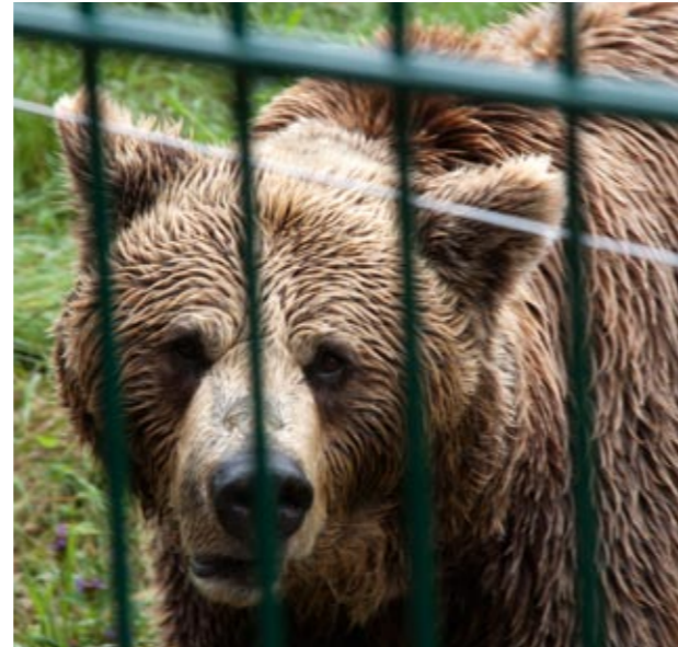
Braunbären hinter Gittern sind ein trauriger Anblick. In Albanien fristet ein beträchtlicher Anteil des gesamten Bärenbestandes sein Dasein in Gefangenschaft.