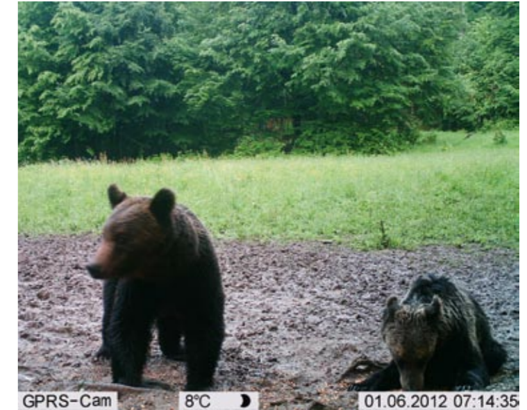
Kamerafallen helfen, Wissenslücken über die Bärenpopulation in einem Gebiet zu schließen und auf dieser Basis wirksame Schutzmaßnahmen zu entwickeln. Im Bild: eine Aufnahme aus den rumänischen Ostkarpaten.

Braunbären es derzeit in Albanien noch gibt. Doch es dürften weniger als 200 Tiere sein - ein historischer Tiefststand. Ein beträchtlicher Anteil des gesamten Bärenbestandes fristet sein Dasein in Gefangenschaft, anstatt durch die Wälder zu streifen und für Bärennachwuchs zu sorgen. Das hat katastrophale Folgen. Durch die Abschüsse der Bärenweibchen und die Entnahme der Jungtiere droht der Bärenbestand in Albanien vollständig zusammenzubrechen. Zudem spielt das Land eine Schlüsselrolle für das langfristige Überleben der Braunbären auf dem westlichen Balkan. Tiere, die aus dem Pindosgebirge im Süden oder aus den Nördlichen Dinariden zuwandern, verschwinden in Albanien oft von der Bildfläche. So droht die gesamte Dinariden-Pindos-Population - die sich von Slowenien im Norden bis Griechenland im Süden erstreckt - langsam auszubluten.