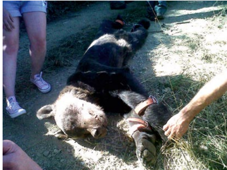
Für diesen spanischen Braunbären kam im August 2012 jede Hilfe zu spät. Er verlor sein Leben in einer Schlingfalle.